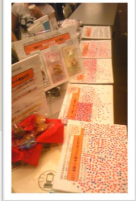
【写真】ご試食アンケートの様子

他のイベントでは、古代米 米粉の普及とマーケティングを含め、ご試食アンケートを行っています。